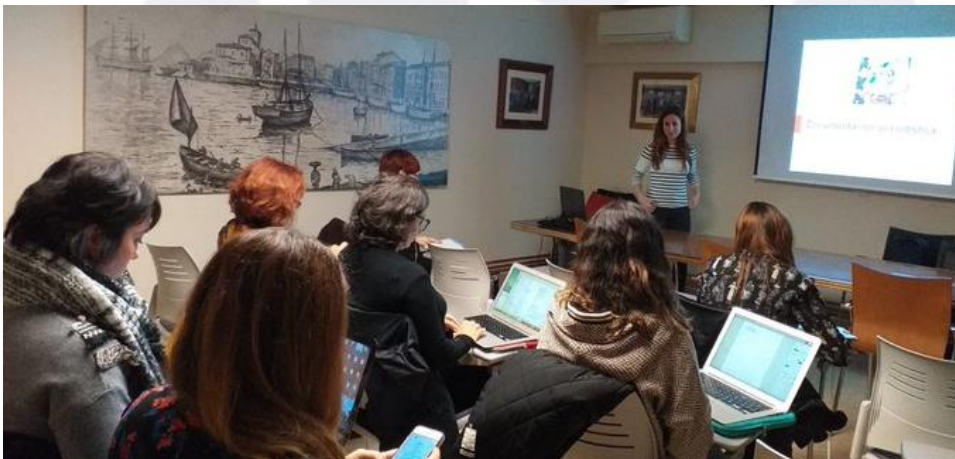
Taller documentación periodística