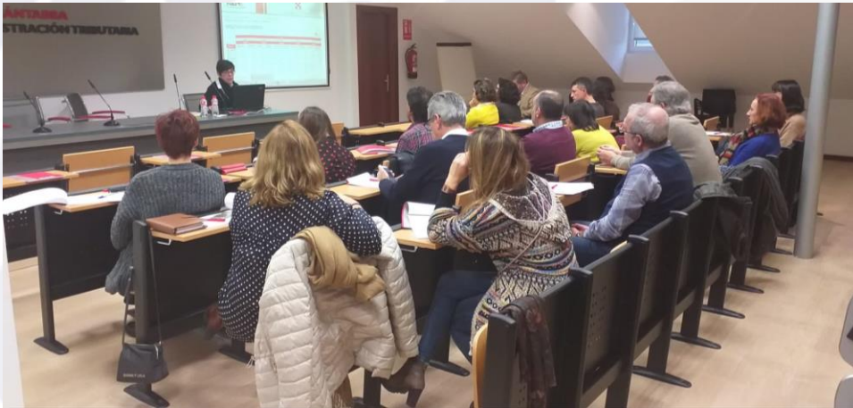
II Jornada ICANE para periodistas