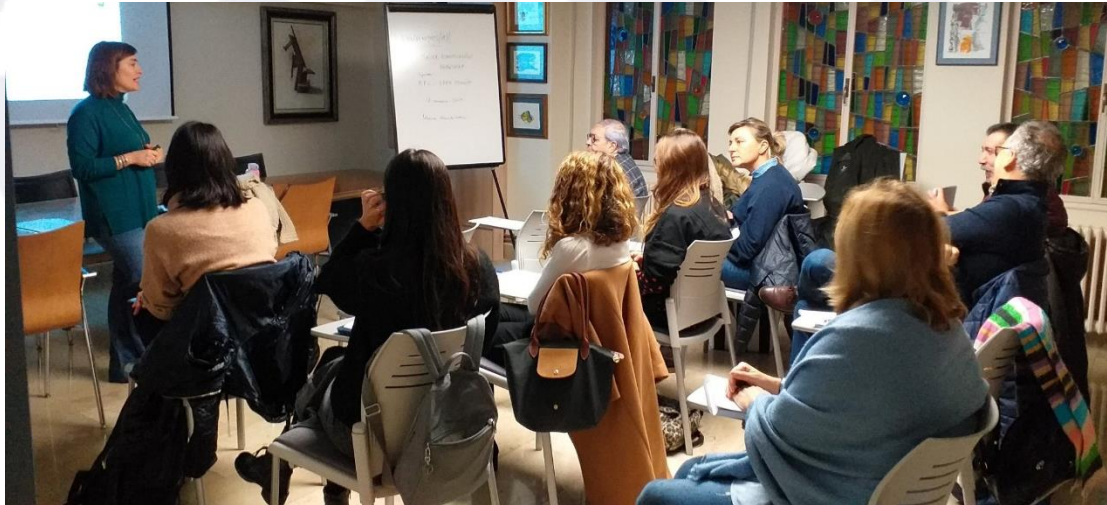
Taller Planificación Financiera I y II