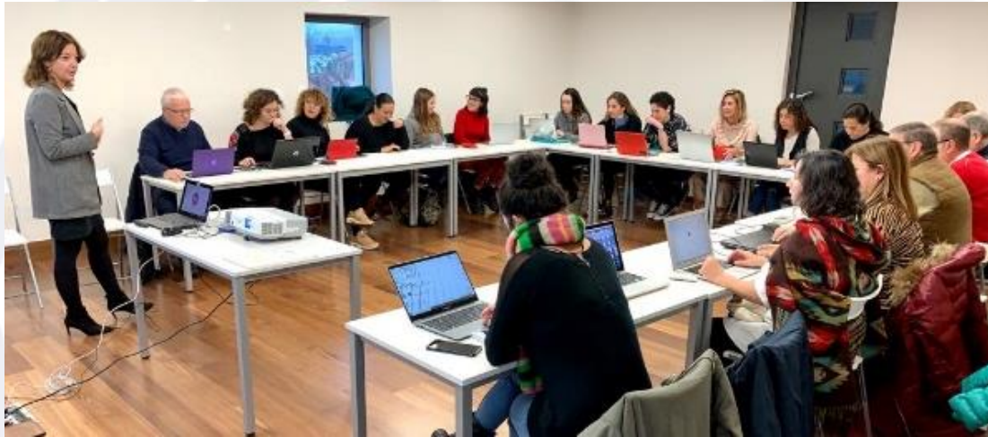
Taller Community Manager