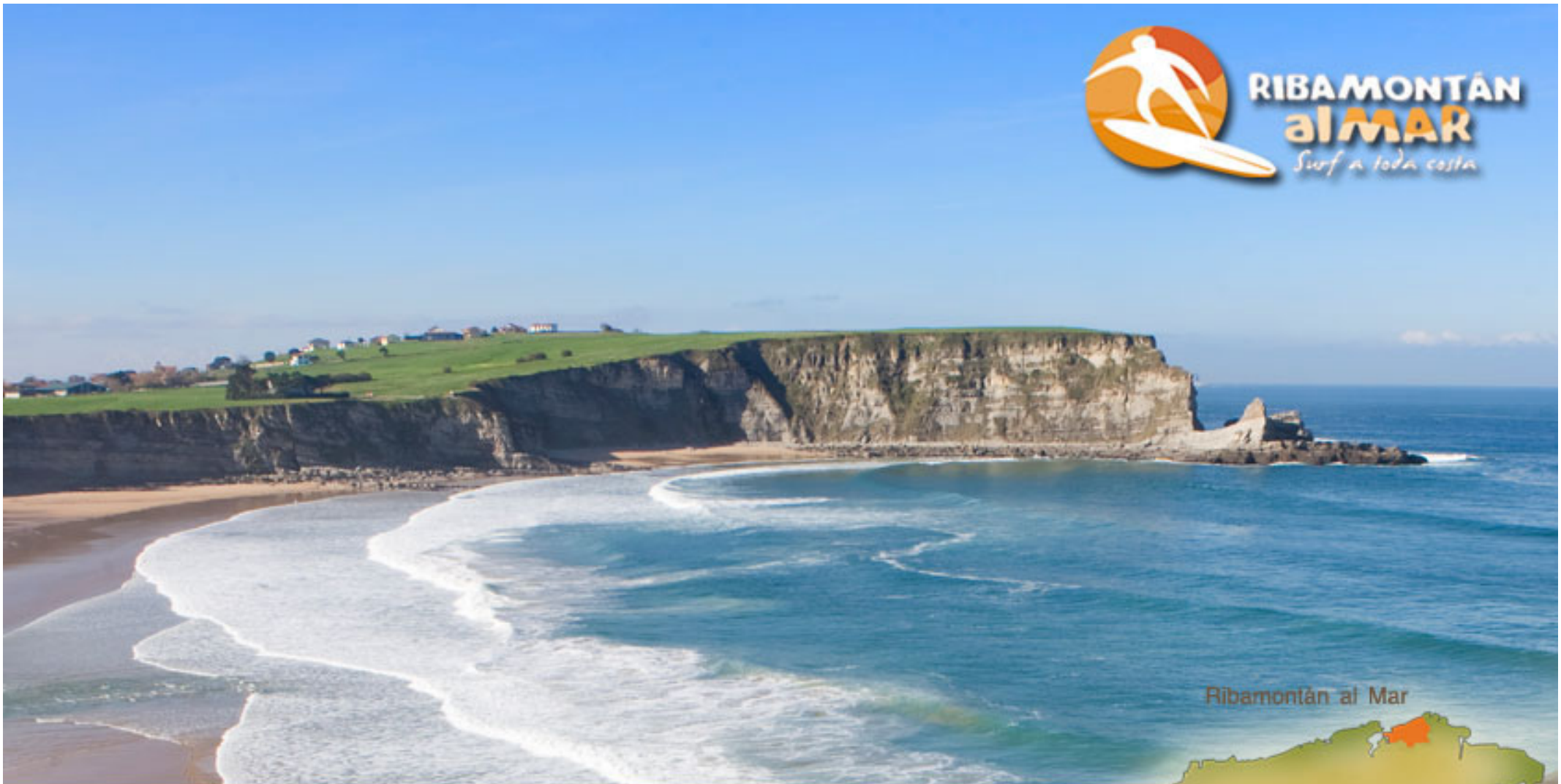
Ribamontán al Mar