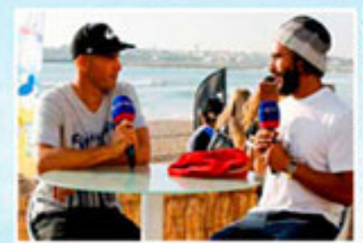
EUROSPORT SE VUELCA CON EL SURF Y SLATER

Kelly Slater ha sido el protagonista más carismático que ha pasado por 'Daily Surf Report', el programa que Eurosport dedica a este deporte y que emite en directo, desde cada una de sus 10 pruebas del ASP World Tour, durante el año.